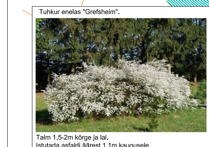
Taim 1,5-2m kõrge ja lai. Istutatud asfaldi äärest 1,1m kaugusele